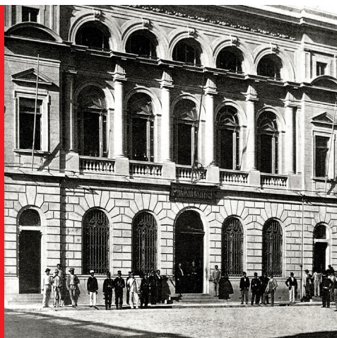
Repartição Central de Polícia em 1891, no Pátio do Colégio