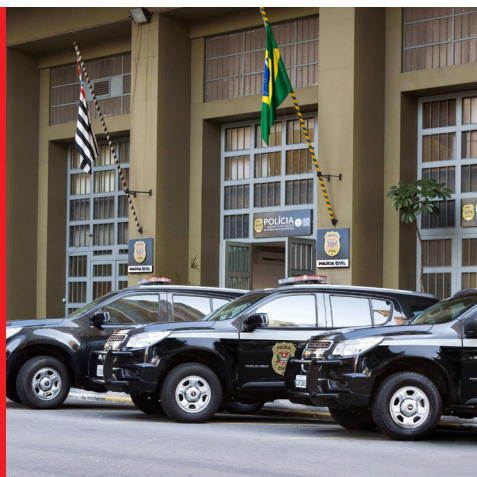
Palácio da Polícia, atual sede da Polícia Civil do Estado de São Paulo