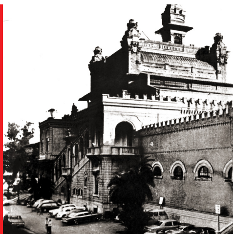
Sede do antigo Departamento das Delegacias Regionais de Polícia da Grande São Paulo (DEGRAN) no Palácio das Indústrias